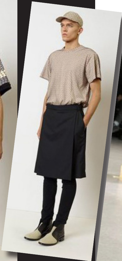
Comme des Garçons Najaar 2012