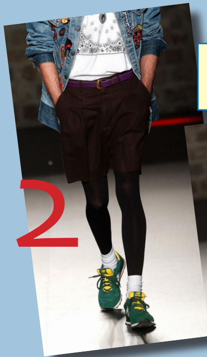
Brain & Beast