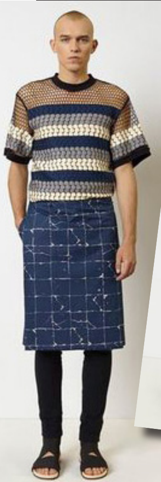
Jean Paul Gaultier Voorjaar 2014