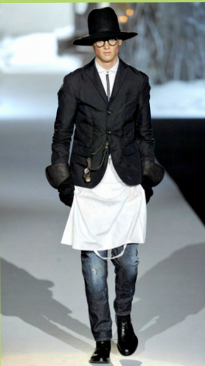
Dsquared2 Najaar 2011