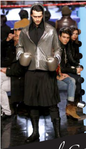
Jean Paul Gaultier