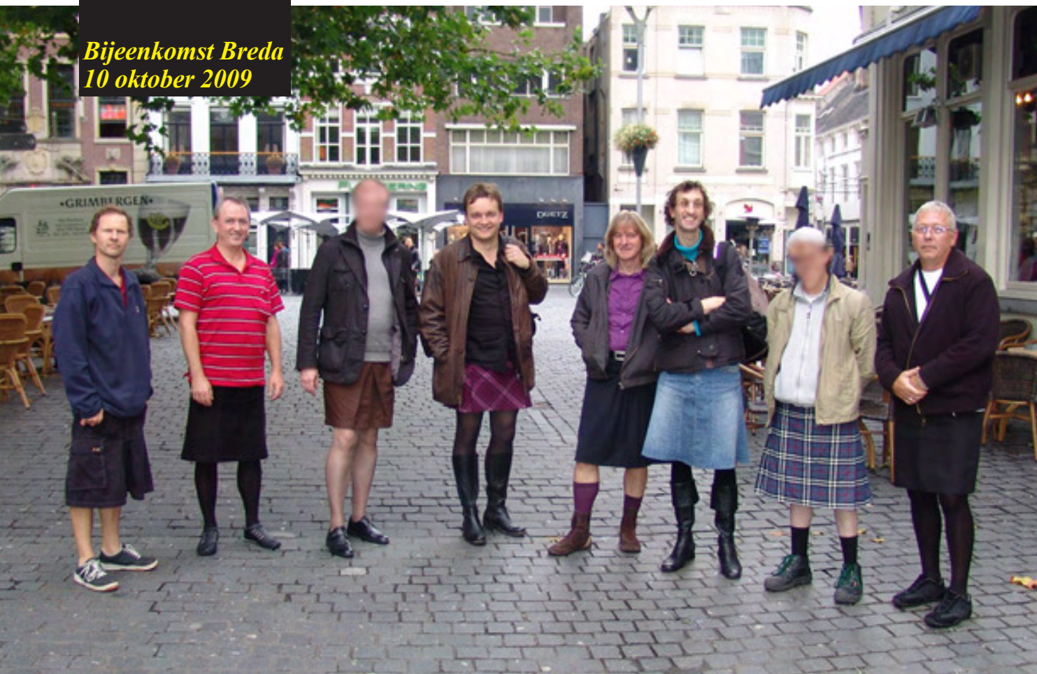
Bijeenkomst Breda 10 oktober 2009

Meld je dus ook aan voor de bijeenkomst van Rok Voor Mannen en laat je zien in rok!