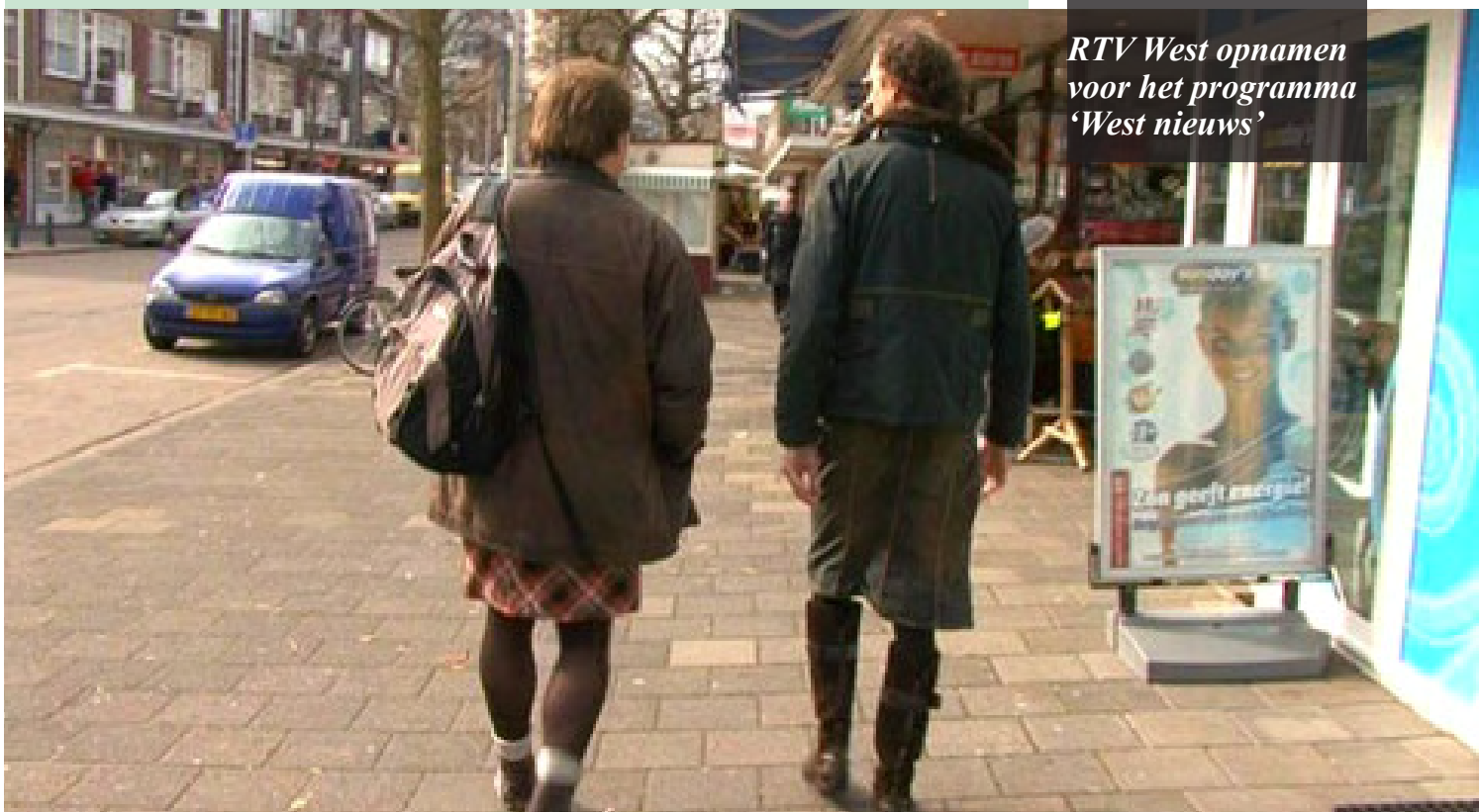
RTV West opnamen voor het programma 'West nieuws'

Er zijn aan de hand van dit artikel enorm veel reacties gekomen op diverse websites en radio en televisie. Onderstaand een zo compleet mogelijk overzicht (eventuele links zijn terug te vinden op het forum):